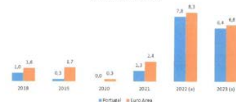
Taxa de inflação (IPC) (%)

Fontes: Banco de Portugal e OCDE Notas: (a) Previsões